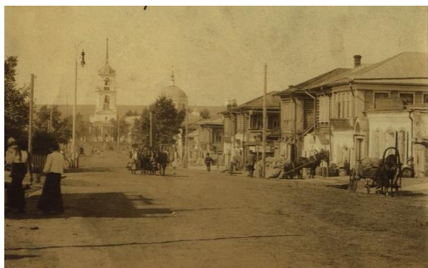
Улица Центральная в начале XX века

В начале XX века Набережные Челны представляли собой большое и богатое торговое село, где наиболее важной частью была улица Дворянская. Она имела большую функциональную нагрузку, являясь почтовым трактом из Елабуги в Мензелинск. Дома на Дворянской улице были деревянные и каменные в два этажа. На первом этаже купцы держали свои лавки и магазины, а на втором жили со своими семьями. Также в ней располагались конторы крупнейших пароходств Волжско-Камского бассейна и наиболее влиятельных хлебных торговцев. К этому времени в Набережных Челнах находилась самая крупная пристань на реке Кама, а также были