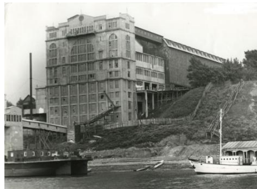
Элеватор в начале XX века

С 1921 по 1930 годы Набережные Челны были кантонным и одновременно волостным центром. Затем кантон был преобразован в Челнинский район. Постановлением ВЦИК СССР от 10 августа 1930 года селу Набережные Челны присвоен статус города. Жителей тогда насчитывалось 9300 человек. Из промышленных предприятий на тот момент действовали: 31 мельница, различные артели, лесозавод «Республиканец», артели «Победа», «Красная заря», «Металлист».