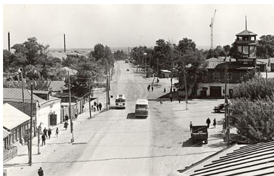
Улица Центральная в середине XX века

В 1963 году Набережные Челны получают статус города республиканского подчинения. До 1963 года город находился в административном подчинении Челнинского (ныне Тукаевского) района (1.01.1961).